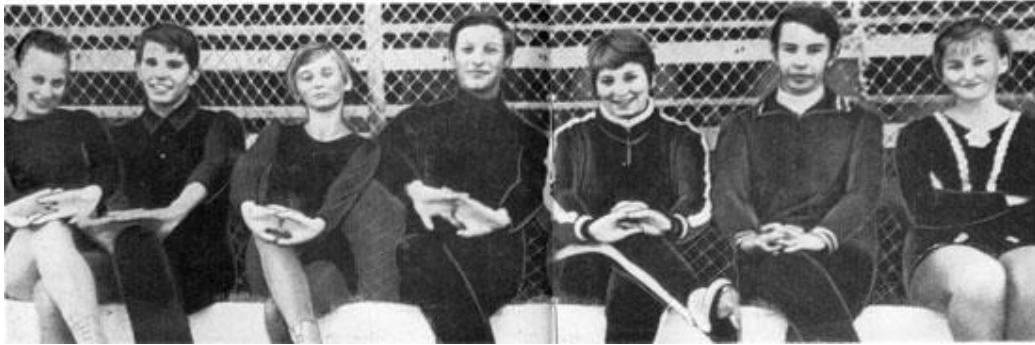
« » . . . . .